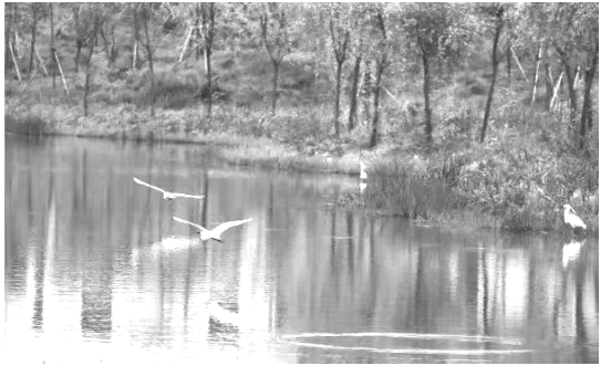
永康杨溪源省级湿地公园

17. 经过这次语文学习活动，相信你对旅行有了更深的领悟。班级开展班会交流本次学习活动的经历与感受，请你从下面表格中选择一项任务参与活动，自拟题目，写一篇不少于 500 字的交流稿。文中不得出现含有考生信息的人名、校名等。