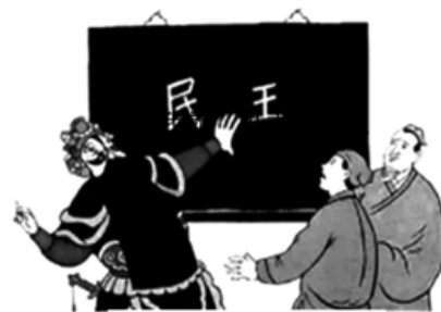
我就是民主少一点

8. 2021年7月21日至23日,习近平来到西藏,祝贺西藏和平解放70周年,看望慰问西藏各族干部群众。2019年底,西藏74个贫困县区全部摘帽,62万多贫困人口全部脱贫。农牧民群众生活实现了从水桶到水管、从油灯到电灯、从土路到柏油路的大变化。上述材料说明