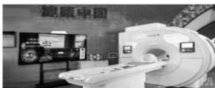
自主研发的磁共振成像装