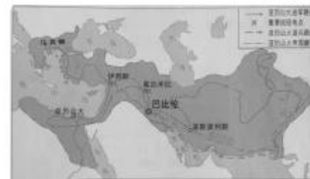
图一 亚历山大东征示意图