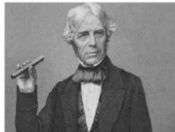
b 法拉第发现电磁感应现象