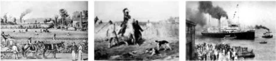
图一 美国南方种植园 图二 俄国地主毒打农奴 图三 佩里军舰抵达日本

图一 美国独立后，南方和北方沿着两条不同的道路发展。在北方，资本主义经济发展迅速，而在南方，则实行的是种植园黑人奴隶制度，南方 1860 年已有黑人奴隶 400 万人。南方奴隶制度是生长在美国社会的赘瘤，它严重窒息了北方工商业的发展，南北矛盾和斗争自 19 世纪初起日趋激烈。1860 年共和党候选人林肯当选总统，林肯主张限制奴隶制的发展，成为南方奴隶主发动叛乱的借口。不久南方 7 州退出联邦，组成“南部同盟”。1861 年 4 月，南方军队挑起战争，内战爆发，史称“南北战争”，这场战争维护了国家统一，废除了奴隶制度，为美国以后经济的迅速发展创造了条件。