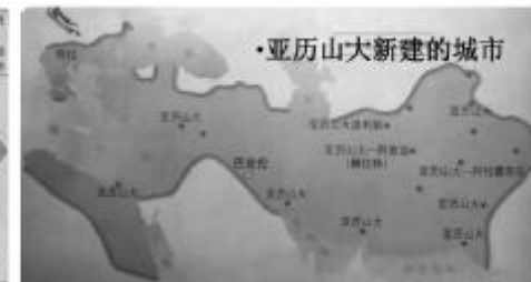
图二 亚历山大新建的城市

图一 亚历山大大帝东征是指公元前 334 年，马其顿国王亚历山大大帝发动的侵略亚洲和非洲的远征。公元前 336 年，亚历山大即位为马其顿国王，两年后统一希腊诸城。公元前 334 年，率军登陆小亚细亚，入侵波斯，然后到埃及和两河流域。公元前 324 年，亚历山大大帝远征印度未果，返回波斯。此次东征历时 10 年。经过伊苏斯之战、高加米拉战役、吉达斯普河战役，亚历山大征服了波斯、埃及、小亚细亚、两河流域。最终建起地跨欧、亚、非三洲的亚历山大帝国。亚历山大东征具有侵略性质，给东方人民带来巨大灾难，掠夺了东方世界的无数财富。