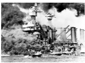
图A 日军偷袭珍珠港