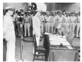
图C 美国军舰“密苏里号”上的日本投降仪式

材料三:美国当时拥有最强大的经济与军事实力,确立了称霸世界的全球战略,日益把苏联看作其称霸全球的主要障碍,企图遏制苏联。美苏两国在社会制度与意识形态方面根本对立,均将对方视为主要敌人。美苏两国之间存在严重的猜疑和不信任……加剧了两国间的冲突与对抗。1947 年 3 月,杜鲁门在国会发表国情咨文,提出了公开的反苏、反共纲领——“杜鲁门主义”,美苏进入“冷战”时期。