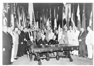
图B 《联合国国家宣言》的签署