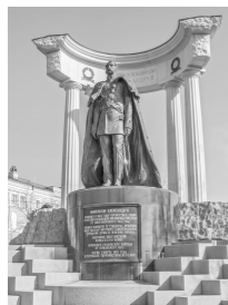
亚历山大二世塑像

新经济政策的实施,表明列宁和布尔什维克党放弃了由战时共产主义直接过渡到社会主义的设想和实践,开始从国情出发,利用市场和商品货币关系来扩大生产,改善和巩固工农联盟,并逐步过渡到社会主义。战时共产主义和新经济政策的最大区别是:前者想越过资本主义,直接过渡到社会主义(失败),后者则是利用资本主义,通过市场渐近地过渡到社会主义。