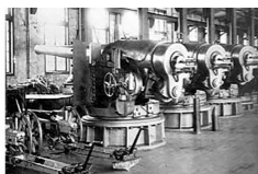
江南机器制造总局炮厂

在近代文明的转型中,世界力图“改变中国”……我们自己在内部改变……无论是李鸿章,还是康有为,无论是孙中山,还是毛泽东……都在尝试利用各种方法,内部改变着“清代中国”,不断催生着一个崭新的中国。