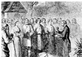
图二 贵族宣读“解放”农奴的法令