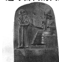
图1《汉谟拉比法典》石柱