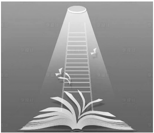
读书是通向成功的阶梯