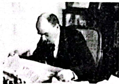
列宁谈新经济政策

25. (5分) 请依据下面图片反映的历史场景，并结合所学知识，写一篇80—120字的小短文。(要求：题目自拟，史实正确，语句通顺，表达完整，体现图片内容之间的比较)