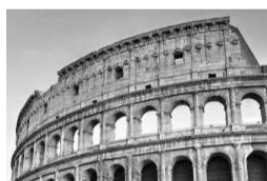
罗马大竞技场遗址外景