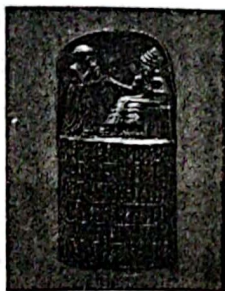
《汉谟拉比法典》石柱