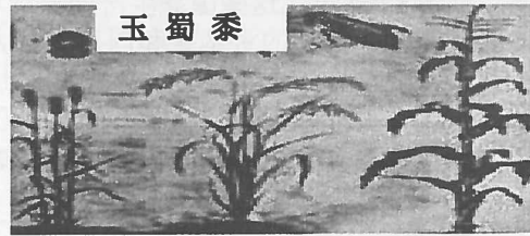
▲《本草纲目》中所附的玉米图