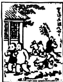
旧时孩子们常玩的“吹嘟嘟”