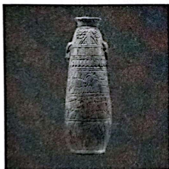
有古埃及图案的古希腊陶器