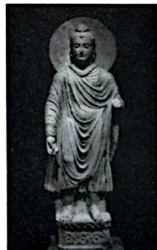
以古希腊神话人物阿波罗为原型的犍陀罗佛像