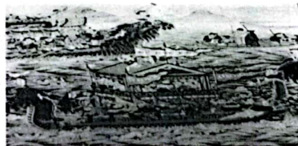
清代《龙舟盛会图》描绘 了端午节赛龙舟的活动

材料二 中国的节日可上溯到远古时期,商周以后不少节日上升为礼俗,变成国家的祭奠仪式。魏晋南北朝至隋唐时期,由于各民族文化的沟通,促进了节日文化的交流,节日文化内容也不断得到充实。宋元以后,有的节日内容已成为礼仪性、娱乐性的活动。传统节