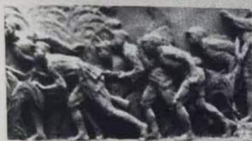
抗日战争(大理石浮雕局部)

中国共产党在全民族抗战中发挥了中流砥柱作用,这是中国人民抗日战争取得完全胜利的决定性因素。中国共产党以卓越的政治领导力和正确的战略策略,指引了中国抗战的前进方向。……抗日战争的实践表明,中国共产党是领导中国人民争取民族独立和人民解放的坚强核心。