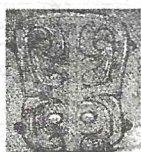
二里头夏都遗址出土的 镶嵌绿松石的铜牌