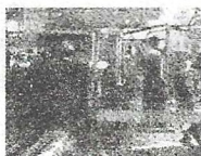
1958 年, 仿制苏联的履带式拖拉机