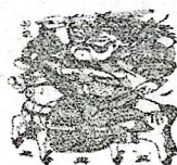
开封朱仙镇木版年画