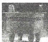
郑州商都遗址 出土的杜岭方鼎