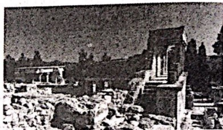
克里特岛宫殿遗址

材料二 克里特岛宫殿遗址的发掘,证明了《荷马史诗》中克诺索斯是真实存在的,将古希腊的历史向前推进了近千年。依据发现的刻在墙壁、柱子和印章上象征海上霸权的三叉戟,考古学家断定这是一位建立地中海霸权的君主。此外遗址中陶器上的彩画、雕塑以及宫殿中的壁画,都堪称古代艺术的杰作。