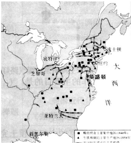
工业革命在美国的扩展

从18世纪后期起，工业革命逐渐从英国向北美传播。美国交通运输体系中最重要的是铁路。1830年，美国只有100英里铁路，到1865年已经达到了3.5万英里。