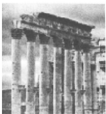
图三 古代西亚建筑

(1)结合所学知识，说明图一、图二有何内在联系。这与哪个历史事件关系比较大？答出一点即可。（4 分）