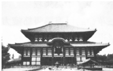
图一 日本奈良古建筑