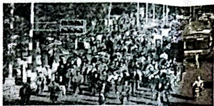
昔日的“自行车王国”