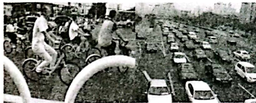
共享单车出行和私家车出行