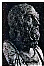
荷马史诗 Iliad Odysseus