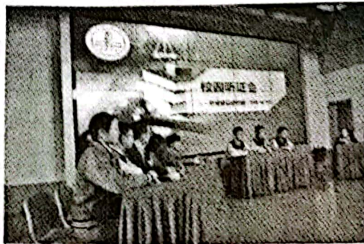
学生参加校园听证会