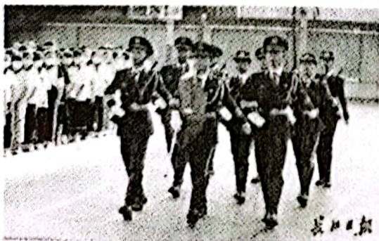
组织学生参加护旗活动