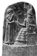
④《汉谟拉比法典》石柱(局部)