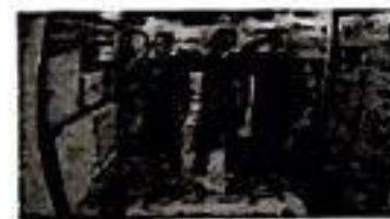
三名航天员进入天和核心舱