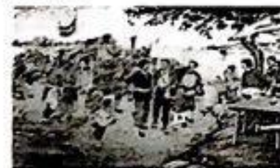
A. 打土豪,分田地,开展土地革命