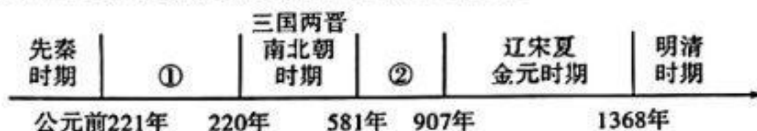
A. 统一多民族国家的建立和巩固