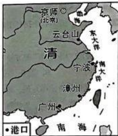
图A 唐朝前期对外贸易港口分布图 图B 清朝前期对外贸易港口分布图

(1)材料一图 A 和图 B 中共同的对外贸易港口是_____;(1 分)北宋前期,四川地区出现_____,这是世界上最早的纸币;(1 分)14 世纪初,中国四大发明中的_____传入欧洲后,对欧洲的火器制造和作战方式产生巨大影响,推动了欧洲社会的变革;(1 分)_____人担当了沟通东西方文化的角色,中国许多重大发明都是由他们传入欧洲的。(1 分)