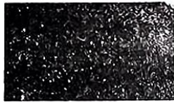
欧洲大航海时代的罗盘