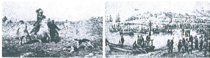
图一俄国地主毒打农奴 图二美国海军舰队到达日本