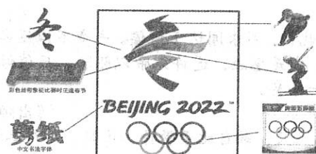
2022年北京冬奥会会徽“冬梦”素材示意图