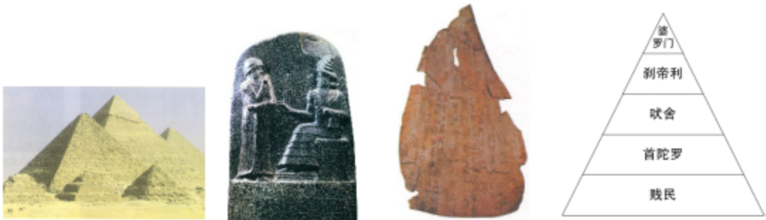
①金字塔 ②《汉谟拉比法典》石柱 ③刻有文字的甲骨 ④种姓制度示意图

17.（10 分）党的二十大提出“尊重世界文明多样性，以文明交流超越文明隔阂、文明互鉴超越文明冲突、文明共存超越文明优越，共同应对各种全球性挑战。”某班以“文明推动人类发展”为题开展探究活动，请完成下列探究任务。